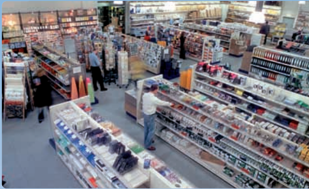
Auf 2.000 Quadratmetern bietet der größte Bürofachmarkt Bayerns eine reiche Auswahl.

Die mittelständische Struktur sieht Dieter Krakowitzer als den größten Wettbewerbsvorteil seines Unternehmens. „Wir machen