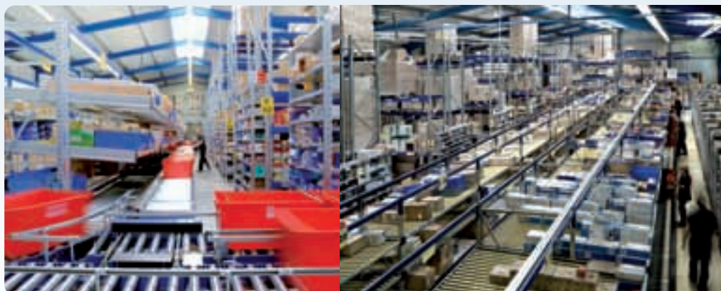
Liebl verdoppelte das Logistik-Areal auf 12.000 Quadratmeter.