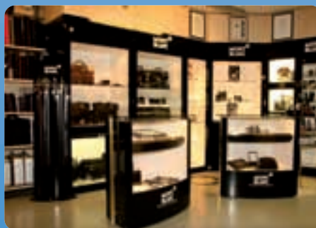
Lederaccessoires und edle Schreibgeräte werten den Büro-Fachmarkt auf.